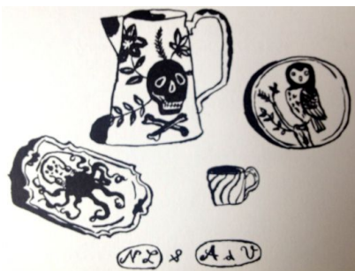
Nathalie Lété pour Astier de Villatte