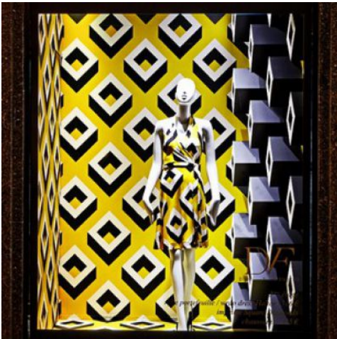
Vitrine DVF aux Galeries Lafayette