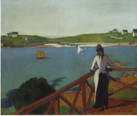
Emile Bernard, "après-midi à Saint Briac", 1887, huile sur toile

Un croquis issu du livre "To Audrey with Love" d'Hubert de Givenchy