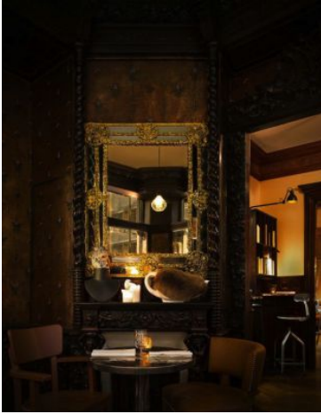
Intérieur du Caffé Stern