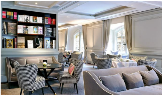
Bar éphémère Chopard à l'hôtel de Vendôme

Les défilés printemps-été 2015 commencent cette semaine à Paris : l'occasion de célébrer la mode et ses icônes, d'Audrey Hepburn à Diane Von Furstenberg. Le programme en dix points essentiels.