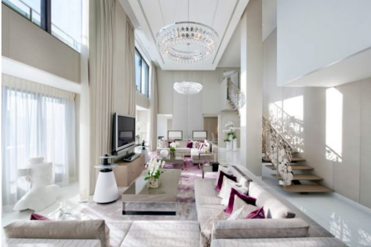
Suite royale du Mandarin Oriental