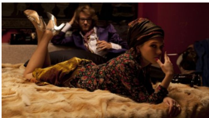
"Saint Laurent" de Bertrand Bonello